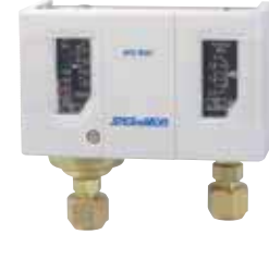
Compact size smallest and lightest