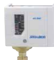
Compact size smallest and lightest