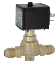
DIN plug coil · Energy-saving