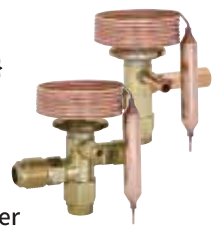
Compact size smallest and lightest