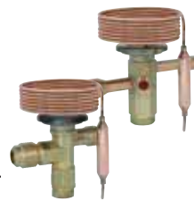
Compact size smallest and lightest