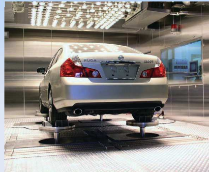
環境槽付き 4POSTER 4POSTER with Environmental Chamber