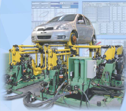
6DOF ロードシミュレータ 6DOF Load Simulator