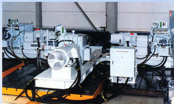
デフ試験機 Differential Test System