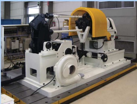
アクスルハブ 回転曲げ試験機 Axle Hub Test System