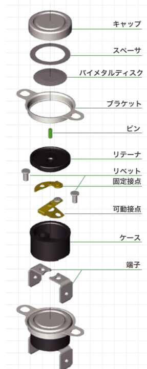
サーモスタット構造図

上記に示すものは、代表的な部品構成を表しています。弊社バイメタルサーモスタットは少ない部品点数で、精密な温度コントロールが実現可能です。