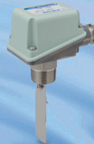
FQS-T形 フロースイッチ