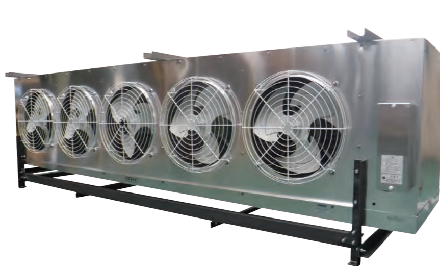
TMA型ユニットクーラ (仮置脚付)