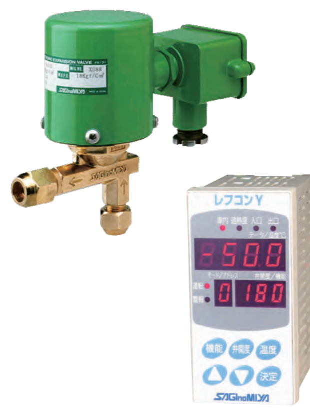
電子膨張弁システム (サギノミヤ製)