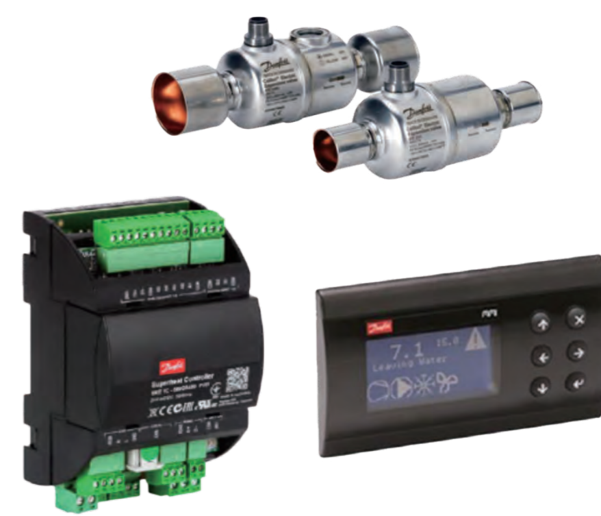
電子膨張弁システム (ダンフォス製)