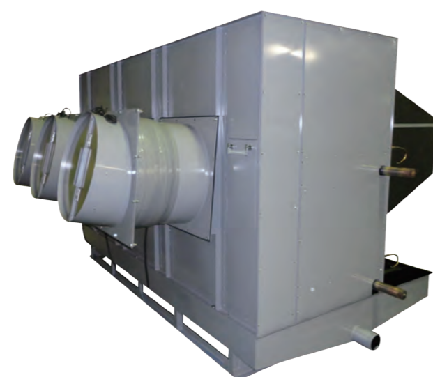
床置型ユニットクーラ