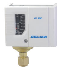
Compact size smallest and lightest