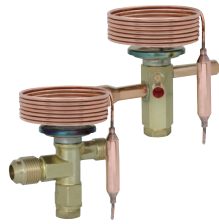
Compact size smallest and lightest