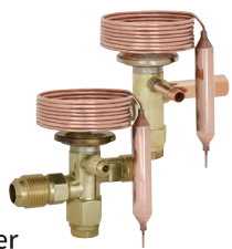
Compact size smallest and lightest