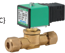
DIN plug coil · Energy-saving