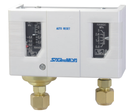
Compact size smallest and lightest